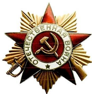
Орден Отечественной войны I степени 24 марта 1945 г. последний бой на Кюстринском плацдарме. Удостоен посмертно