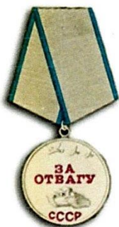
Медаль «За Отвагу» Март 1944 г. за бои в районе г. Березноватое